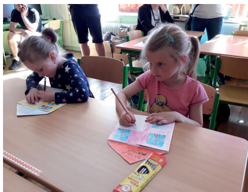
Zápis dětí do 1. třídy ZŠ