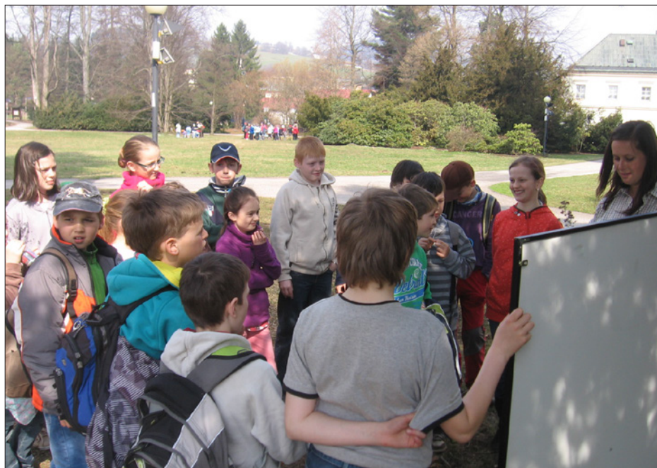
Byla tam čtyři stanoviště a všechna od Krnapu.