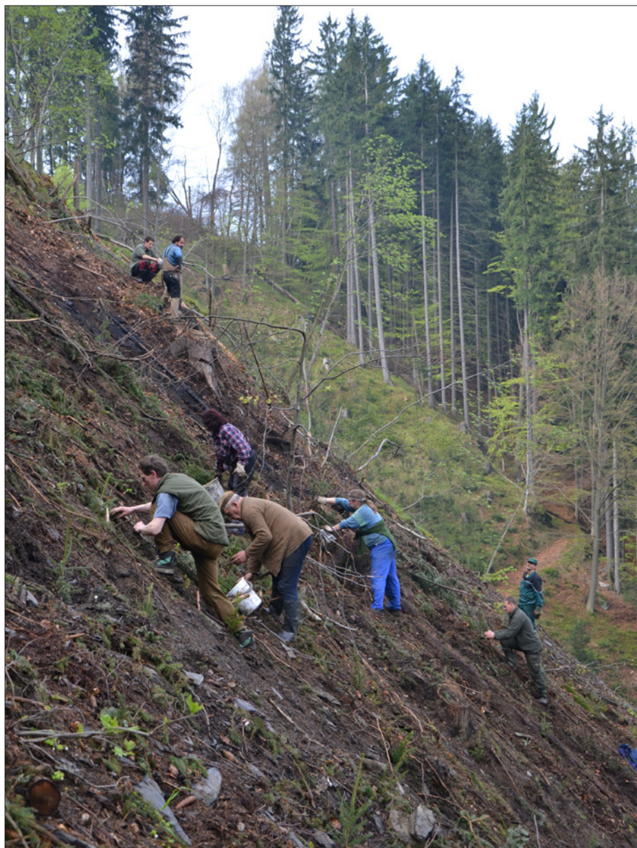
Myslivecké sdružení Kákov během měsíce dubna a května vysadilo na třech brigádách celkově 5000 ks smrčků na katastrech v Poniklé a Vichovské Lhotě. Na této fotografii obtížné vysazování v Poniklé, kde se říká "na schodech".