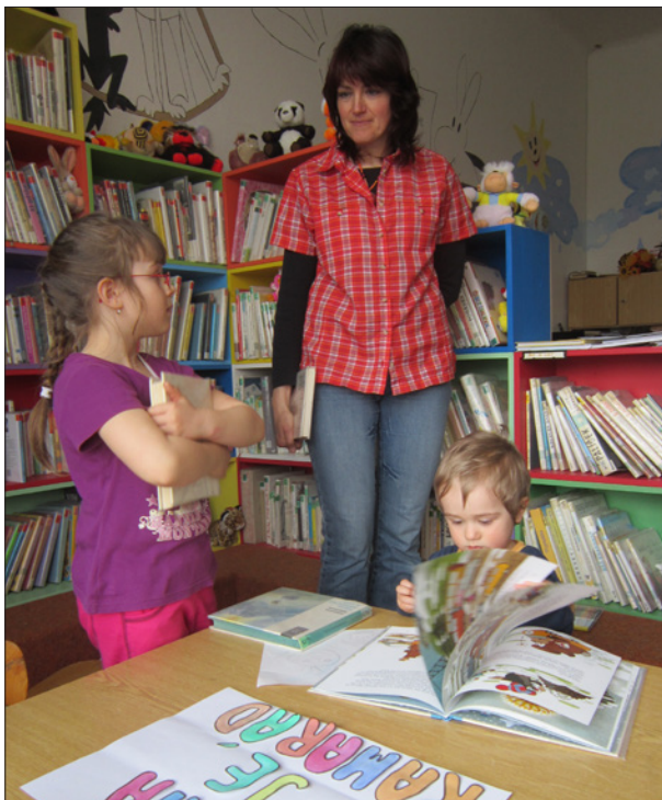
V úterý 23. dubna jsme se šli s dětmi a maminkami v naší krásné knihovně.