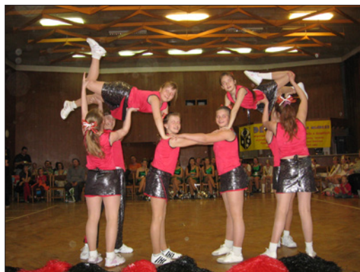
Pusinky na soutěžích.