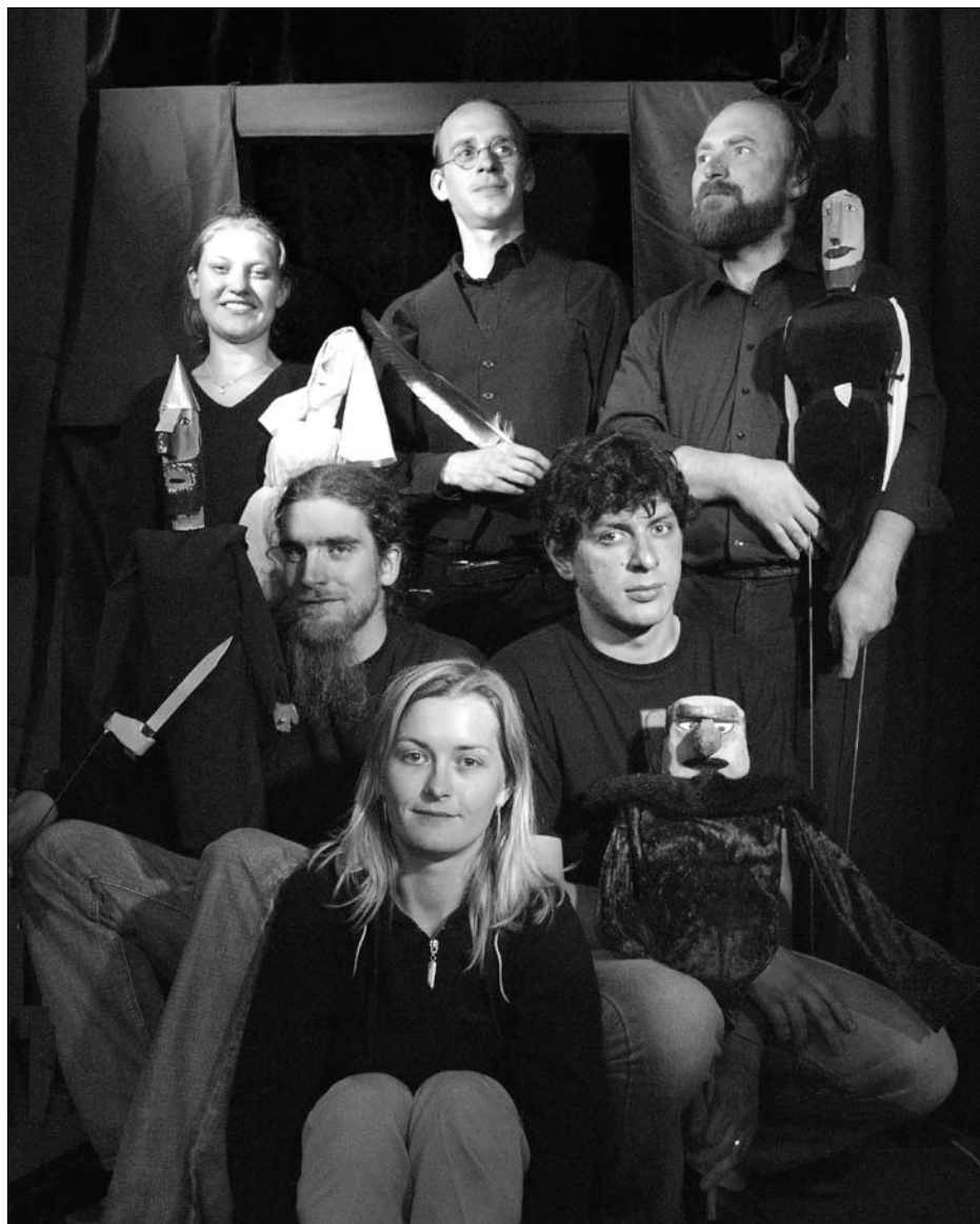
Bažantova loutkářská družina.