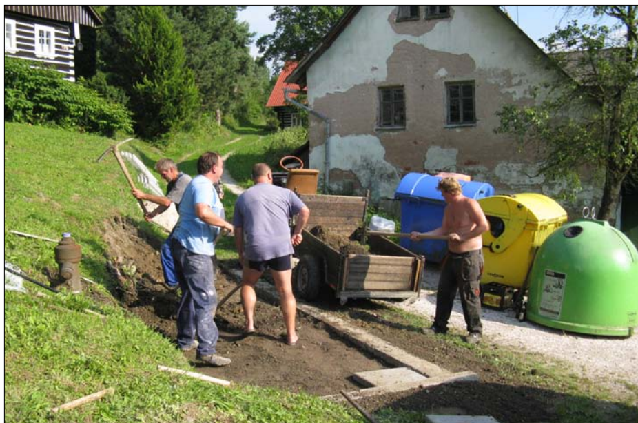
V horní části obce si místo vylepšili sousedé, kteří ho využívají. Patří jim obdiv a velký dík.

V obci byla vylepšena čtyři sběrná místa tříděného odpadu. V horní části obce si místo vylepšili sousedé, kteří ho využívají. Patří jim obdiv a velký dík. Určitě máme více takových šikovných lidí, proto se nebojte a přijďte se svými nápady na OÚ. Určitě vám vyjdeme vstříc. Místo před ZŠ bylo přemístěno za bývalou farou. Zde postupně vzniká sběrné místo. Byl zakoupen lis pro pytlový sběr. Tímto krokem budeme převážet méně vzduchu a ušetříme prostředky z rozpočtu obce. Přemístění bylo na přání některých z vás, zároveň bude v příštím roce dokončeno zateplení obálky naší základní školy a vybudován parčík před školou. Náves se tak stane útulnou a krásnou. Takto bude náves naší obec reprezentovat na