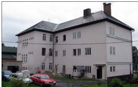
Škola dostala nová okna.