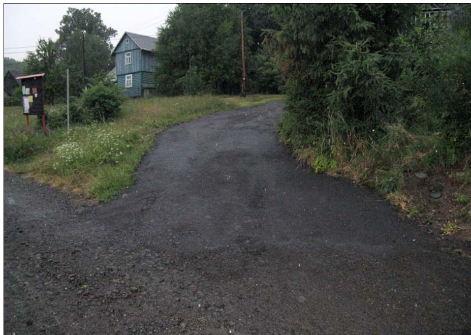
Díky M. Skalskému máme opět opravenu další část cest na Jilmu.

Svoz nebezpečného odpadu se zcela netradičně uskuteční v SOBOTU 2. ŘÍJNA podle tradičního časového harmonogramu. Začínáme v 8:00 hodin Nové Vsi u líhne pstruhů, končíme v 10:00 hodin v Jilmu. Nebezpečným