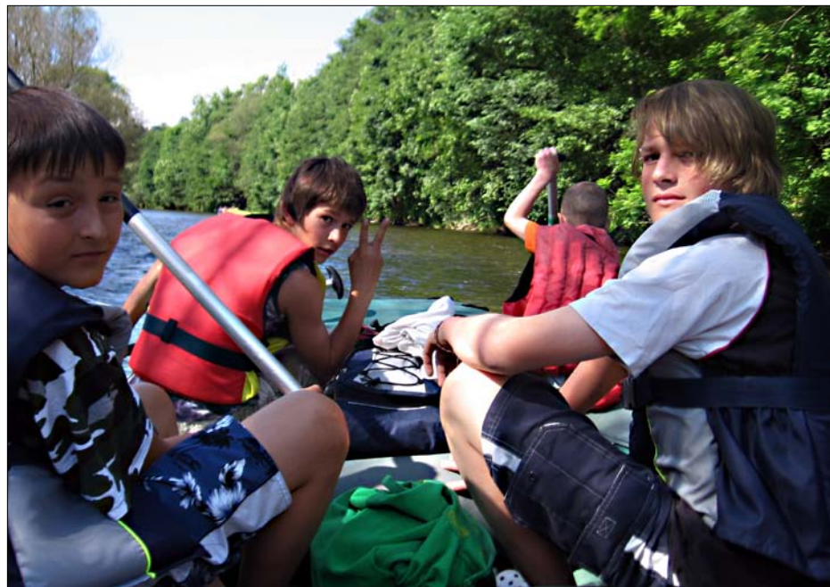
Na raftech jsme byli rozděleni na čtyři skupiny. Jeli jsme asi 8 km po Jizeře.