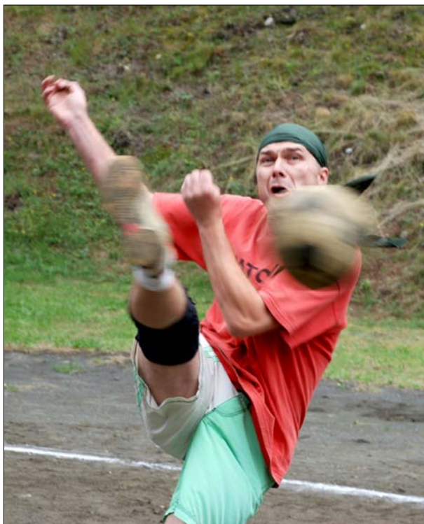
Tradiční nohejbalový turnaj dosáhl v letoším roce plnoletosti.