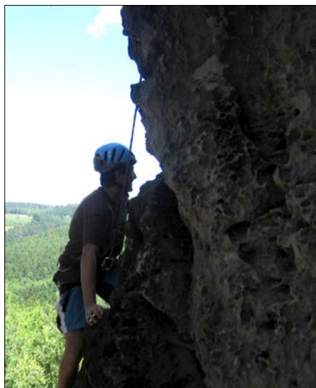
Byli jsme lézt na skalách nad kempem.